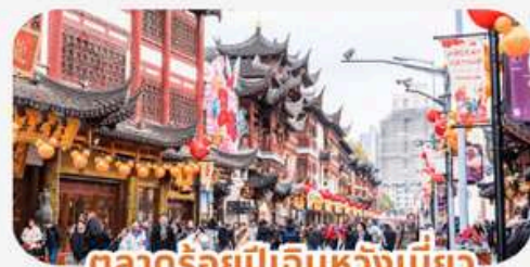
ตลาดร้อยปีเดินหวังเมี่ยว