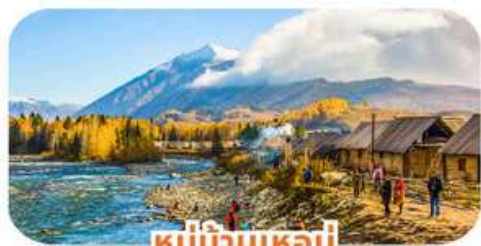
หมู่บ้านเหมอู๋